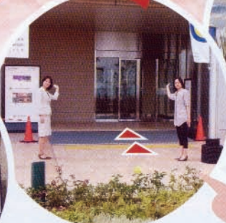
11階 風の広場から お店が見えます。