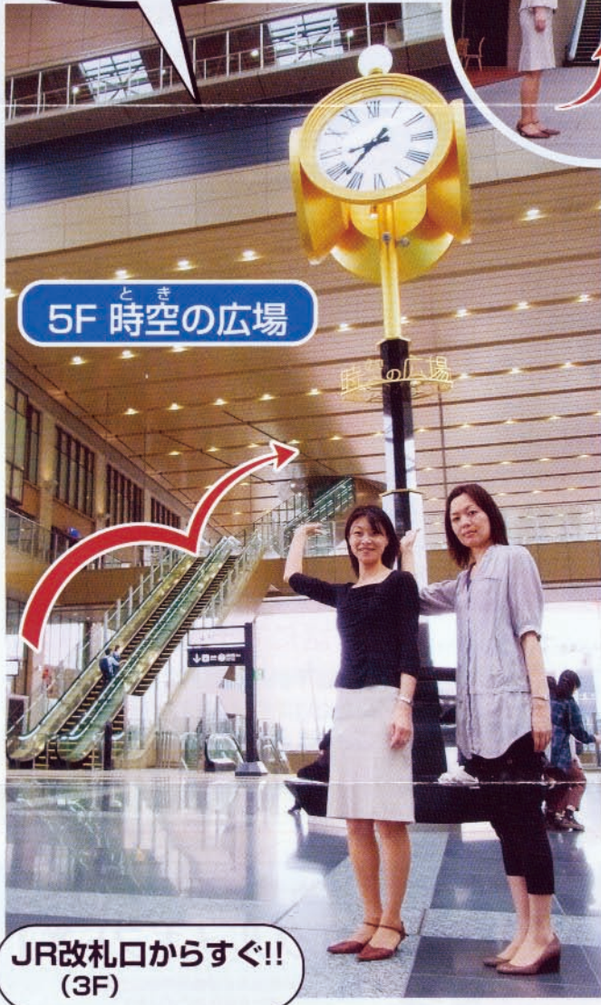
ととき 5F 時空の広場